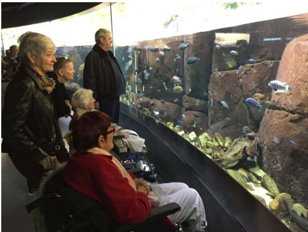
Fra besøg på Den blå planet